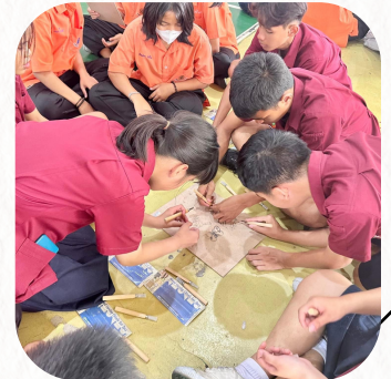
กิจกรรมภาพพิมพ์แกะไม้