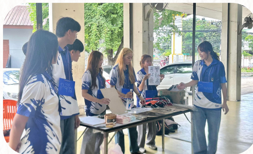
กิจกรรมภาพพิมพ์แกะไม้