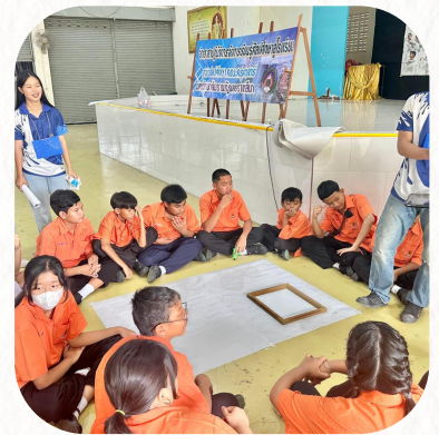
กิจกรรมภาพพิมพ์ตะแกรงไหม