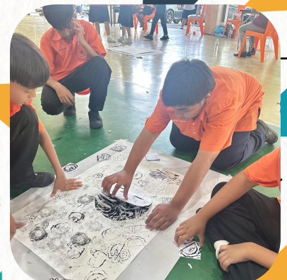
กิจกรรมภาพพิมพ์โลโก้