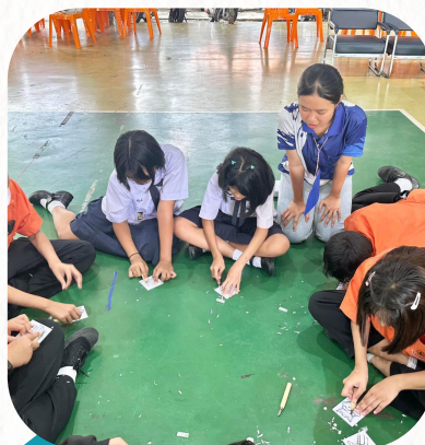
กิจกรรมภาพพิมพ์โลโก้