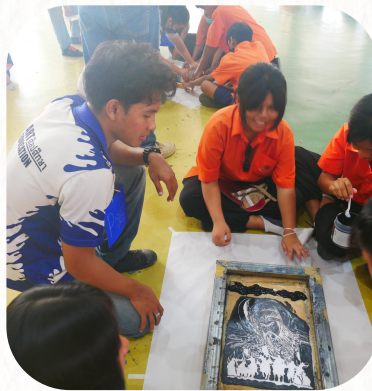
กิจกรรมภาพพิมพ์ตะแกรงไหม