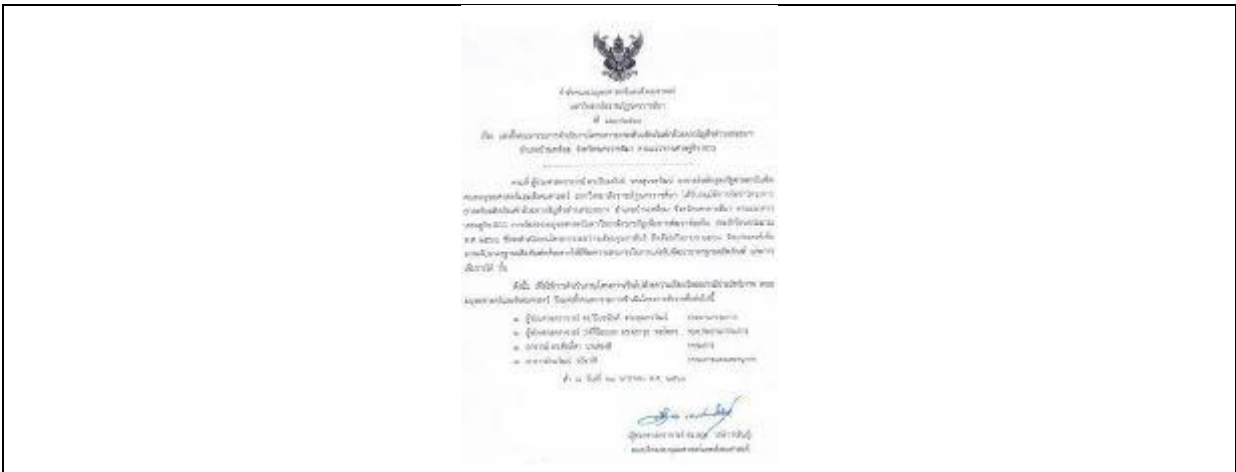
ภาพที่ 2 คำสั่งแต่งตั้งคณะกรรมการ คำสั่งที่ 123/2566