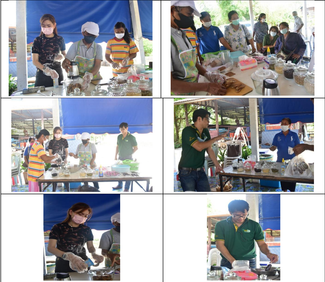
ภาพที่ 6 การพัฒนาผลิตภัณฑ์กล้วยตาก

กิจกรรม 2.2 การออกแบบผลผลิตกล้วยตาก วิทยากรได้ให้องค์ความรู้กับสมาชิกกลุ่มผลิตกล้วยตาก และได้มีการแบ่งกลุ่มเพื่อแสวงหาแนวทางในการพัฒนารูปแบบผลิตภัณฑ์ ปรากฏดังภาพที่ 7