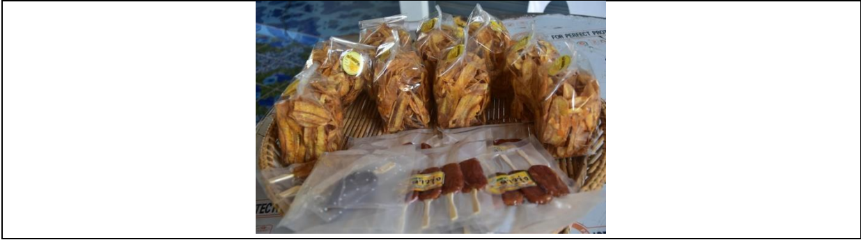
ภาพที่ 7 การออกแบบผลผลิตภัณฑ์กล้วยตาก