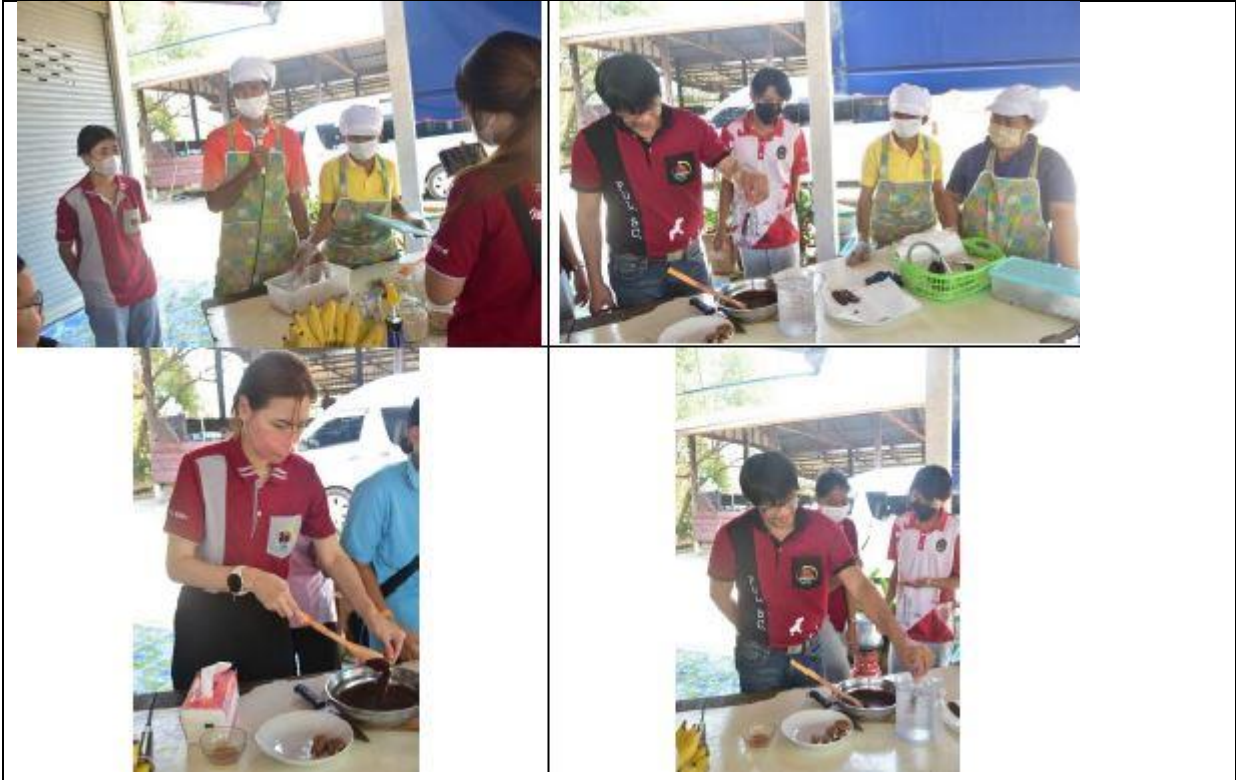
ภาพที่ 5 การพัฒนาสินค้ากล้วยตากสู่มาตรฐานผลิตภัณฑ์ชุมชน