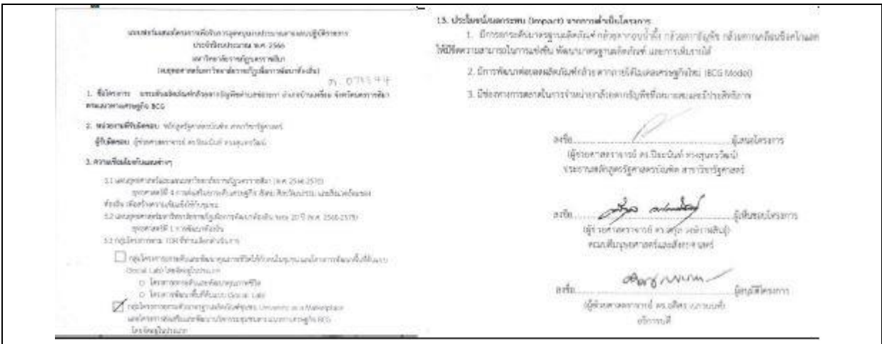
ภาพที่ 1 โครงการที่ได้รับการอนุมัติ

ผู้รับผิดชอบโครงการ ได้เสนอโครงการ ยกระดับผลิตภัณฑ์กล้วยตากธัญพืชตำบลช่อระกา อำเภอบ้านเหลื่อม จังหวัดนครราชสีมา ตามแนวทางเศรษฐกิจ BCG ตามกรอบยุทธศาสตร์มหาวิทยาลัยราชภัฏนครราชสีมา ยุทธศาสตร์ที่ 4 การส่งเสริมยกระดับเศรษฐกิจ สังคม ศิลปวัฒนธรรม และสิ่งแวดล้อมของท้องถิ่น และได้รับการอนุมัติโครงการ จึงได้มีการเสนอขอแต่งตั้งคณะกรรมการ เพื่อกำหนดขั้นตอนการขับเคลื่อนกิจกรรมให้บรรลุตามวัตถุประสงค์ ปรากฏดังภาพที่ 1