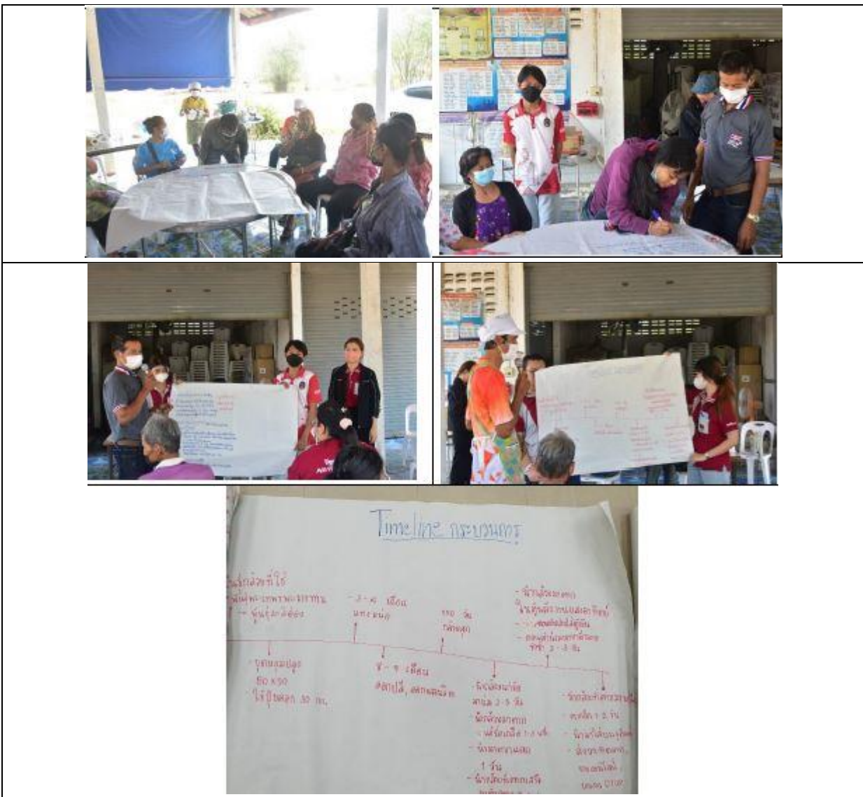
ภาพที่ 3 Time Line กระบวนการผลิต

ผู้รับผิดชอบโครงการได้ดำเนินการประสานงานกลุ่มเป้าหมายที่จะลงพื้นที่บริการวิชาการในการพัฒนาชุมชนตามหลัก BCG โดยได้ประสานไปยังกลุ่มผลิตกล้วยตากในพื้นที่ตำบลช่อระกา อำเภอบ้านเหลื่อม จังหวัดนครราชสีมา ในการที่จะลงพื้นที่เพื่อสร้างความเข้มแข็งให้กับชุมชน ดำเนินกิจกรรมอบรมเชิงปฏิบัติการพัฒนาสินค้ากล้วยตากสู่มาตรฐานผลิตภัณฑ์ชุมชน และการวิเคราะห์ Time line กระบวนการผลิตกล้วยในพื้นที่ เพื่อให้ทราบถึงสายพันธุ์ที่ปลูก กล้วยน้ำว้า พันธุ์มะลิอ่อน มีวิธีการปลูก การดูแลบำรุงรักษา ระยะเวลาในการออกผล การเก็บผลผลิตการแปรรูปเบื้องต้นในพื้นที่ อุปกรณ์ในการแปรรูป ตู้อบพลังงานแสงอาทิตย์ ในวันที่ 24 มีนาคม พ.ศ. 2566 ปรากฏตามภาพที่ 3