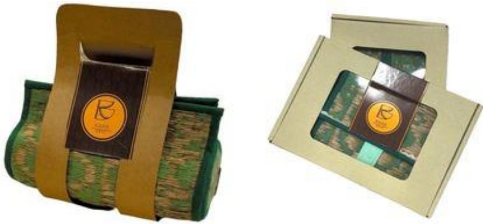
ภาพบรรจุภัณฑ์สำหรับผลิตภัณฑ์จากเส้นใยของกาบลาน