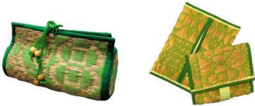
ภาพผลิตภัณฑ์จากเส้นใยของกาบลาน