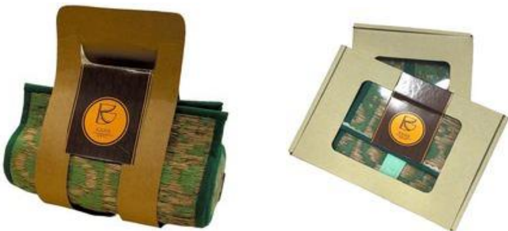
ภาพบรรจุภัณฑ์สำหรับผลิตภัณฑ์จากเส้นใยของกาบลาน