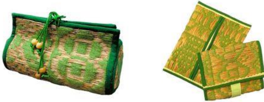
ภาพผลิตภัณฑ์จากเส้นใยของกابلาน