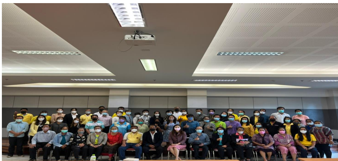
ภาพที่ 2.17 กิจกรรมการติดตามความก้าวหน้าและรายงานผลการดำเนินงาน