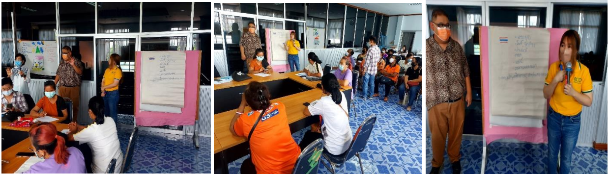
ภาพที่ 2.12 กิจกรรมการจัดอบรมเชิงปฏิบัติการพัฒนาศักยภาพของครัวเรือนยากจนในพื้นที่ตำบลพระพุทธร อำเภอลาดพระเกียรติ “กิจกรรมการพัฒนาตราสินค้าเพื่อยกระดับผลิตภัณฑ์ผักปลอดภัย”