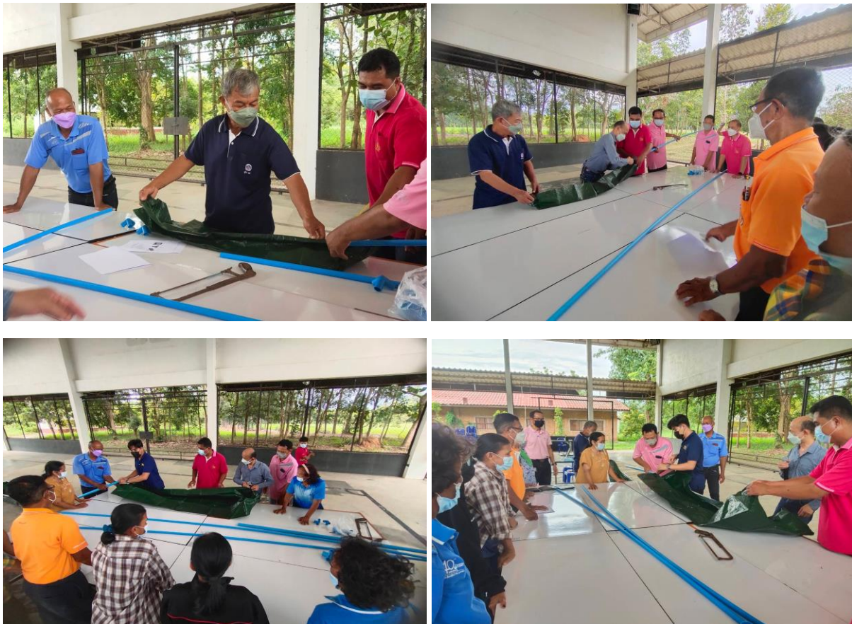
ภาพที่ 2.9 กิจกรรมการจัดอบรมเชิงปฏิบัติการพัฒนาศักยภาพของครัวเรือนยากจนในพื้นที่ตำบลหนองพลวง อำเภอจักราช

ผลการอบรมเชิงปฏิบัติการนวัตกรรมต้นแบบปลูกผักปลอดภัยตั้งโต๊ะดังกล่าว ส่งผลให้สมาชิกครัวเรือนยากจนทราบจำนวนและขนาดของวัสดุ อุปกรณ์ที่ใช้ในการทำ ตลอดจนเทคนิคในการติดตั้งและการออกแบบปลูกผักปลอดภัยตั้งโต๊ะ ซึ่งสมาชิกครัวเรือนยากจนสามารถนำวัสดุอื่นในชุมชน อาทิ ไม้ไผ่ ท่อสแตนเลส ท่อน้ำพีวีซี กระเบื้อง หรือวัสดุเหลือใช้อื่น ๆ มาประยุกต์ใช้ในการปลูกผักตั้งโต๊ะได้ด้วยตนเอง