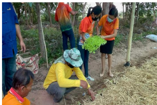
ภาพที่ 2.1 พื้นที่แปลงรวมตำบลหนองพลวง อำเภอจักราช