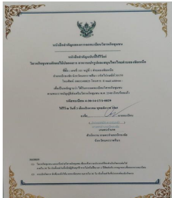
ภาพที่ 2.15 การตั้งกลุ่มวิชาสหกิจชุมชนและการชี้แจงระเบียบของกลุ่มฯ ตำบลธงชัยเหนือ อำเภอปักธงชัย

หลังจากการดำเนินงานกิจกรรมการจัดอบรมเชิงปฏิบัติการพัฒนาศักยภาพของครัวเรือนยากจนในพื้นที่ ตำบลธงชัยเหนือ อำเภอปักธงชัย คณะดำเนินงานจากมหาวิทยาลัยราชภัฏนครราชสีมา พร้อมด้วยผู้นำชุมชนในพื้นที่ ได้ส่งเสริมและสนับสนุนให้ครัวเรือนยากจนกลุ่มปลูกผักปลอดภัยตำบลธงชัยเหนือ ให้ยื่นจดทะเบียน วิชาสหกิจชุมชน ณ สำนักงานเกษตรอำเภอปักธงชัย จังหวัดนครราชสีมา โดยการจดทะเบียนจัดตั้งวิชาสหกิจชุมชน ปลูกผลไม้ปลอดสาร อาหารแปรรูปและสมุนไพรไทยตำบลธงชัยเหนือ ได้รับการจัดตั้งเรียบร้อยเมื่อวันที่ 3 สิงหาคม 2565