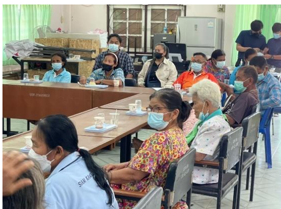
ภาพที่ 2.6 กิจกรรมอบรมเชิงปฏิบัติการให้ความรู้การจัดตั้งวิสาหกิจชุมชน/และการบริหารจัดการกลุ่มในพื้นที่ตำบลหนองพลวง อำเภอจักราช

นอกจากนี้ ในช่วงบ่ายได้มีจัดกิจกรรมอบรมพัฒนาทักษะการบริหารจัดการกลุ่มของครัวเรือนยากจนปลูกผักปลอดภัยตำบลหนองพลวง เพื่อให้การส่งเสริมการทำงานและการรวมกลุ่มที่เข้มแข็งของครัวเรือนยากจนตำบลหนองพลวงเป็นรูปธรรมและชัดเจนขึ้น คณะดำเนินงานจากมหาวิทยาลัยราชภัฏนครราชสีมา ได้จัดอบรมพัฒนาทักษะการบริหารจัดการกลุ่มแก่ครัวเรือนยากจนปลูกผักปลอดภัยตำบลหนองพลวง จำนวน 2 เรื่อง คือ