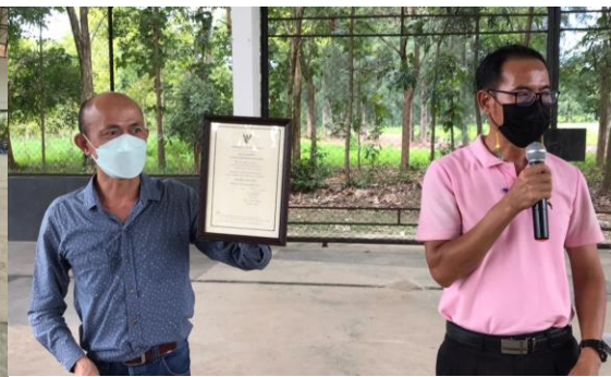
ภาพที่ 2.14 การประชุมกลุ่มวิสาหกิจชุมชนปลูกผักปลอดภัยหนองพลวงอุดมสุข และส่งมอบใบจดทะเบียน วิสาหกิจชุมชน