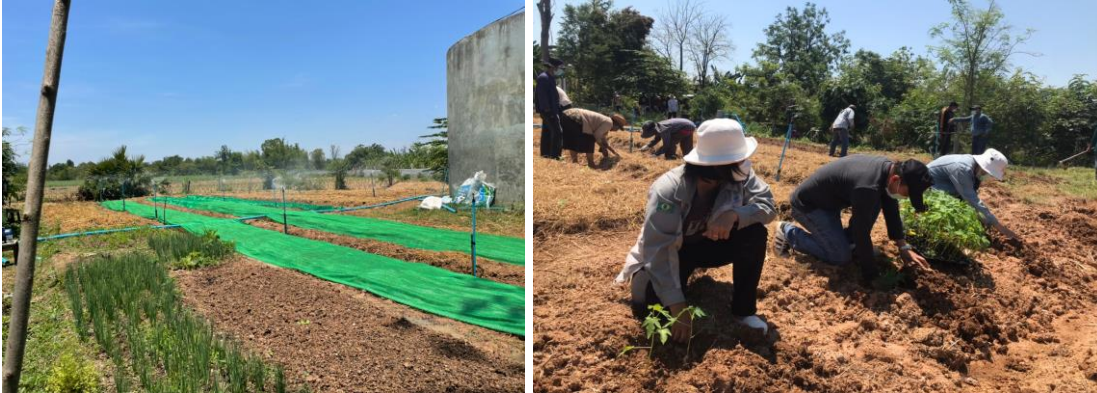
ภาพที่ 2.3 พื้นที่แปลงรวมตำบลธงชัยเหนือ อำเภอปักธงชัย

อย่างไรก็ตามสำหรับพื้นที่ที่มีการบริหารจัดการแปลงรวม คณะผู้วิจัยได้มีการประชุมเพื่อสรุปข้อมูลพื้นที่แปลงรวมในแต่ละตำบล เพื่อจัดทำหนังสือ “แสดงเจตจำนงการใช้พื้นที่เพื่อการเกษตร” โดยมีการระบุช่วงเวลาในการใช้พื้นที่อย่างน้อย 3 ปี กับหน่วยงานเจ้าของพื้นที่ที่เป็นภาครัฐ ภาคเอกชน และอาสาสมัครที่อนุญาตให้ใช้พื้นที่ ขนาดพื้นที่ และวิธีการดำเนินงานอย่างละเอียด มีการลงชื่อเป็นรายลักษณะอักษรอย่างชัดเจน