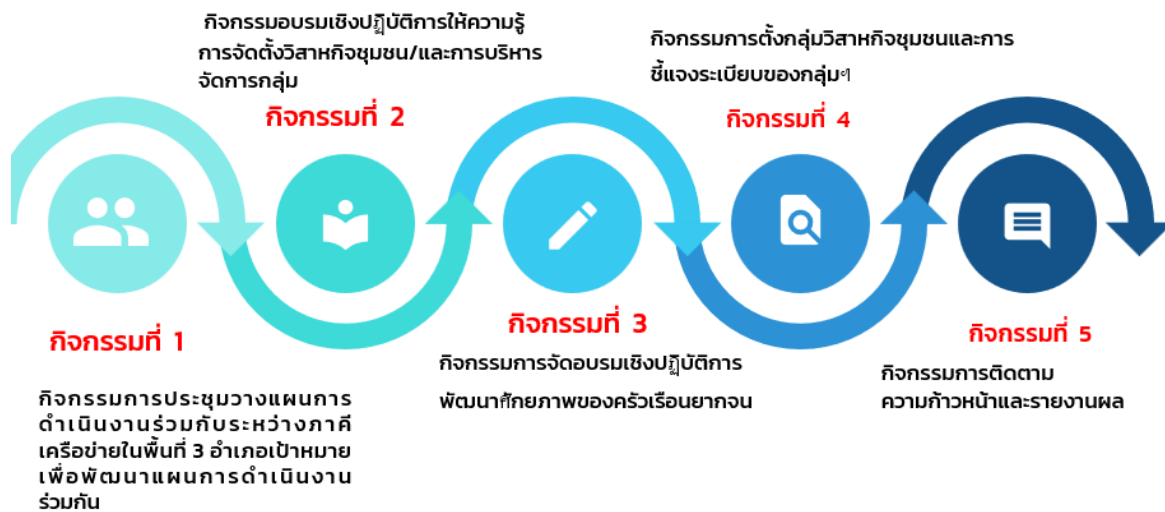
ภาพที่ 2.4 กำหนดกระบวนการ/ขั้นตอนการดำเนินโครงการฯ

ครัวเรือนยากจน ที่มีการรวมกลุ่มเพื่อการบริหารจัดการในพื้นที่แปลงรวม สามารถสร้างกลุ่มอาชีพได้อย่างเป็น ทางการ ภายใต้การวางกรอบทิศทางการพัฒนากลุ่มร่วมกัน เพื่อให้เกิดการสร้างรายได้ และพัฒนาคุณภาพชีวิต ครัวเรือนยากจนให้มีความเป็นอยู่ที่ดีขึ้น ซึ่งมีการดำเนินงานในพื้นที่เป้าหมาย จำนวน 3 ตำบล ได้แก่ 1) ตำบล หนองพลวง อำเภอจักราช 2) ตำบลธงชัยเหนือ อำเภอบัวชุม และ 3) ตำบลพระพุทธ อำเภอเฉลิมพระเกียรติ โดยมีการกำหนดกระบวนการ/ขั้นตอนการดำเนินเป็น 5 กิจกรรม