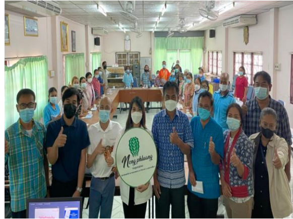
ภาพที่ 2.7 กิจกรรมอบรมเชิงปฏิบัติการให้ความรู้การจัดตั้งวิสาหกิจชุมชน/และการบริหารจัดการกลุ่มในพื้นที่ ตำบลหนองพลวง อำเภอจักราช