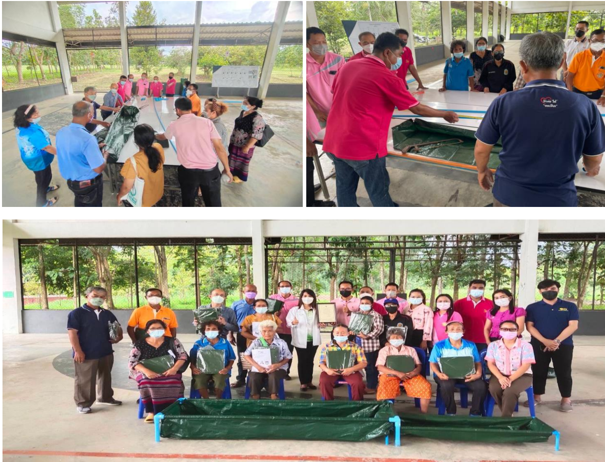
ภาพที่ 2.9 กิจกรรมการจัดอบรมเชิงปฏิบัติการพัฒนาศักยภาพของครัวเรือนยากจนในพื้นที่ตำบลหนองพลวง อำเภोजักราช (ต่อ)