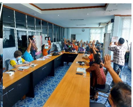
ภาพที่ 2.8 กิจกรรมอบรมเชิงปฏิบัติการให้ความรู้การจัดตั้งวิสาหกิจชุมชน/และการบริหารจัดการกลุ่มใน พื้นที่ตำบลพระพุทธ อำเภอเฉลิมพระเกียรติ