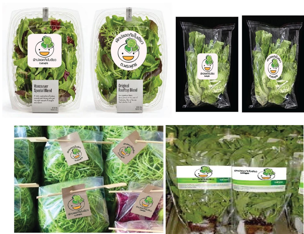
ภาพที่ 2.13 การจัดทำตราสัญลักษณ์ผักปลอดภัยในรูปแบบต่าง ๆ

แนวความคิดในการออกแบบ คือการนำพื้นที่สีเขียวที่มีผักบานอยู่บนใบหน้าของเด็กที่ยิ้มอย่างมีความสุข สื่อถึงความเป็นมิตร ปลอดภัย และมีสุขภาพที่ดี ผักกะหล่ำปลีสื่อถึงผักในพื้นที่และความอ่อนของใบสื่อถึงความสามัคคีของวิสาหกิจชุมชน