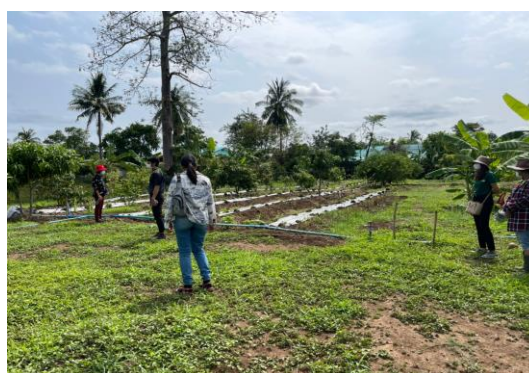
ภาพที่ 2.2 พื้นที่แปลงรวมตำบลพระพุทธ อำเภอเฉลิมพระเกียรติ