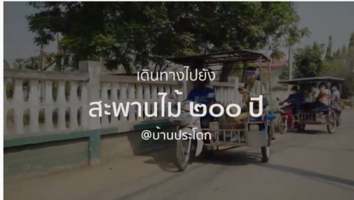
#โครงการสืบสาน รักษา ต่อยอด หมื่นโวย Pride of Place - เที่ยวถิ่นชุมชนเกษตรอมเมืองโคราช

มีหน่วยงานที่เกี่ยวข้องร่วมบูรณาการดำเนินการประชาสัมพันธ์ขึ้นโดยนำข้อมูลและผลตั้งแต่ระยะที่ 1, 2 และ 3 จัดทำเป็นคลิป และสื่อสารออนไลน์ ดังนี้ https://www.youtube.com/watch?v=tk0LONoXZQs