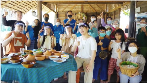
#โครงการสืบสาน รักษา ต่อยอด หมื่นโวย Pride of Place - เที่ยวถิ่นชุมชนเกษตรอมเมืองโคราช

และมีนักท่องเที่ยวเข้าท่องเที่ยวจริงจาก ททท. ที่โครงการได้เชิญให้เป็นผู้ร่วมทดลองการท่องเที่ยวโดยชุมชน จากคำบอกเล่าของคนในชุมชน แจ้งว่า “เป็นกิจกรรมหนึ่งที่นักท่องเที่ยวมีความสุขมากที่ได้ร่วมโรยเส้น จับเส้นขนมจีนอย่างสนุกสนานแม่ๆ ทุกคนเป็นปลื้มมาก” และเกิดรายได้เข้าสู่ชุมชนอย่างแท้จริง