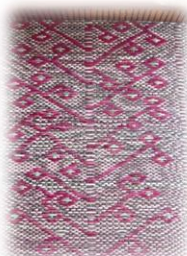
ลายดอกตัว

กิจกรรมโครงการ จำนวน 3 กิจกรรม ประกอบด้วย กิจกรรมการถ่ายทอดองค์ความรู้เกี่ยวกับการพัฒนาผลิตภัณฑ์และการพัฒนาลายเสื้อก จำนวน 2 ลาย กิจกรรมการถ่ายทอดองค์ความรู้การพัฒนาผลิตภัณฑ์ของที่ระลึกจากเสื้อก และผ้าในพื้นที่ การออกแบบบรรจุภัณฑ์/ช่องทางการตลาด