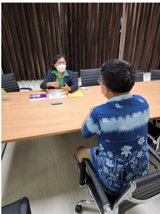
ภาพที่ 4 ร่วมพูดคุยกับหัวหน้าโครงการในกลุ่มผู้สูงอายุ