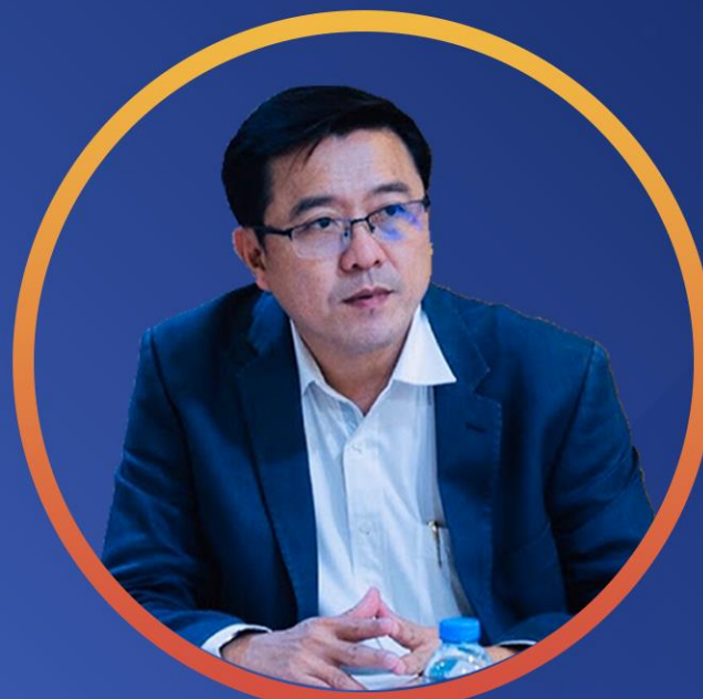
รศ.ดร.ชัคตตรีัย ริยะสวัสดิ์ รองอธิการบดีฝ่ายบริการวิชาการ และพัฒนาท้องถิ่น